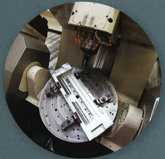
Fraisage 5 axes