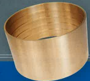
Palier en bronze